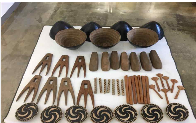
신창동 선사유적지 교구(유물모형) 제작