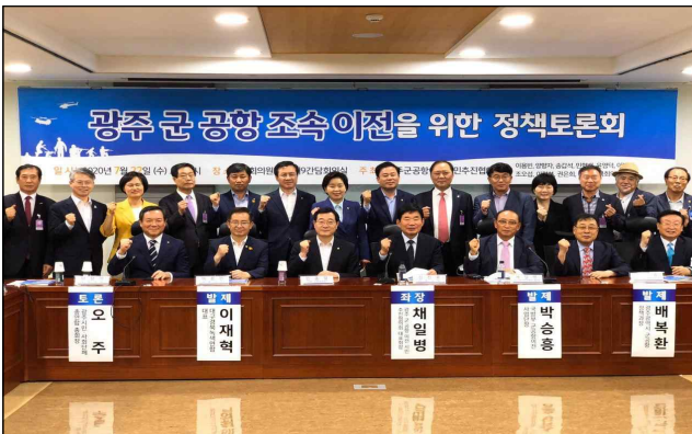
광주 군공항 이전을 위한 국회 정책토론회('20. 7월)