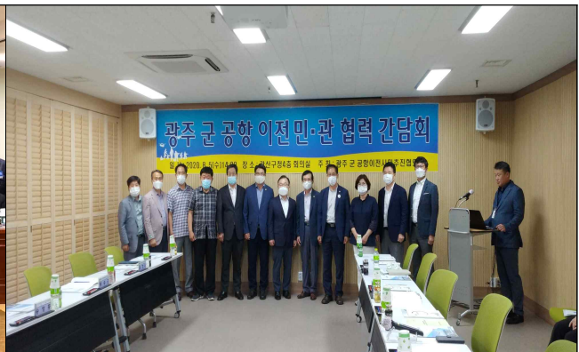
광주 군공항 이전 민관협력 간담회('20. 8월)