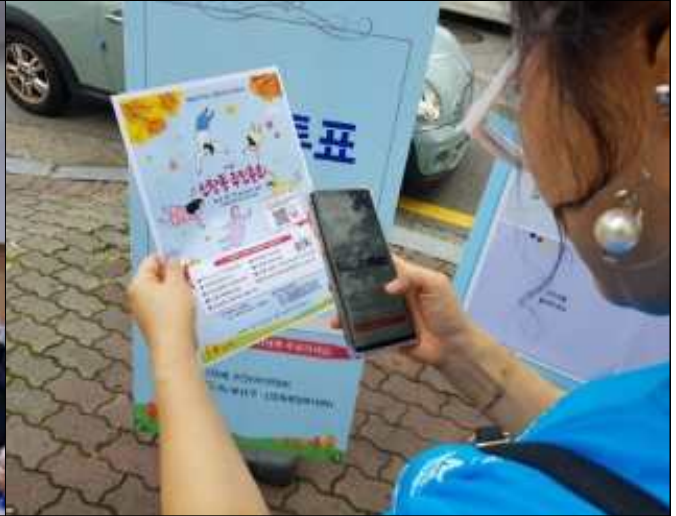
주민총회 사전투표(신창동, 10.4.금)