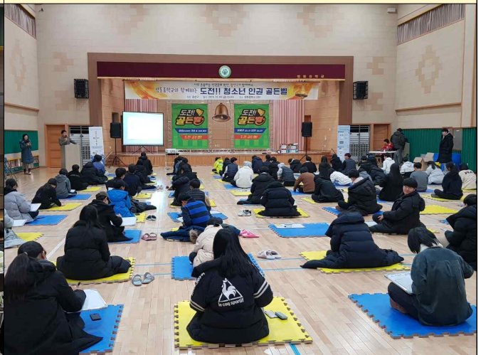
인권골든벨 현장 홍보