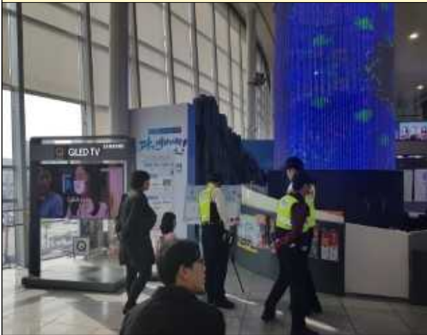
네이밍 선호도 조사(광주송정역)