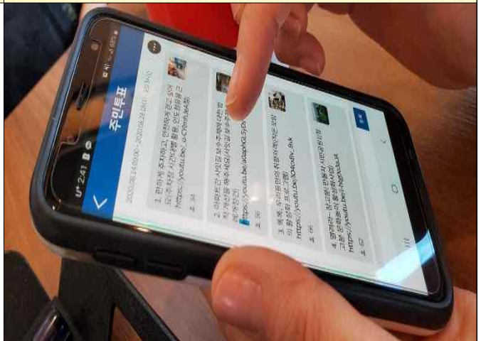
2020 주민총회 마을의제 사전투표(첨단2동)