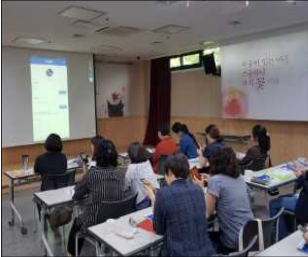
마을플래너 대상 활용법 설명회