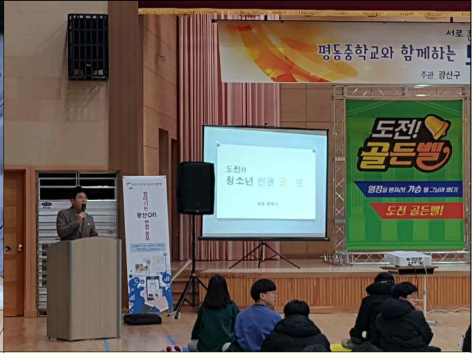
인권골든벨 현장 홍보