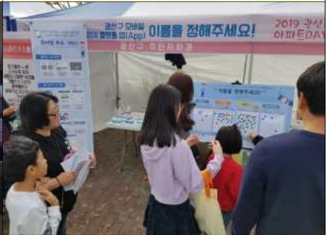
네이밍 선호도 조사(2019아파트데이)