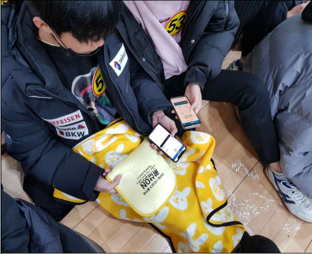
인권골든벨 현장 홍보