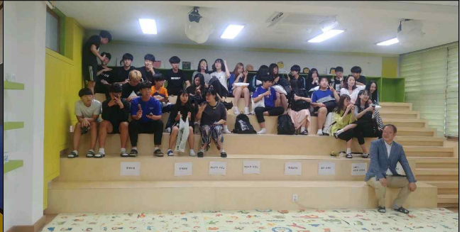
2018 영동 공간 개소(월곡중 「아띠」)