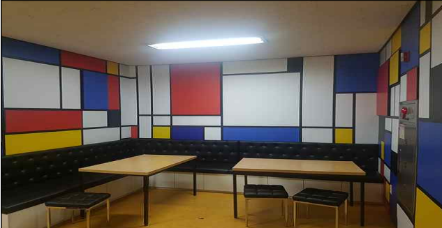
2018 영동 공간 개소(큰별초 「심표」)