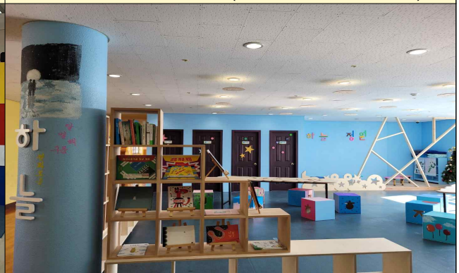
2020 영동 공간(선운중)*코로나19로 미개소 상태