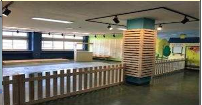
2019 영동 공간 개소(신가중 「신가아트편」)