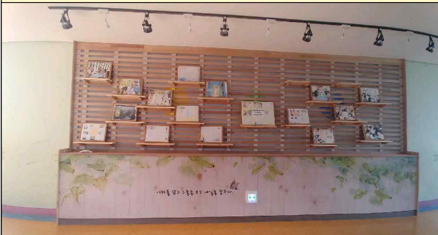
2019 영동 공간 개소(선창초 「결(結)」)