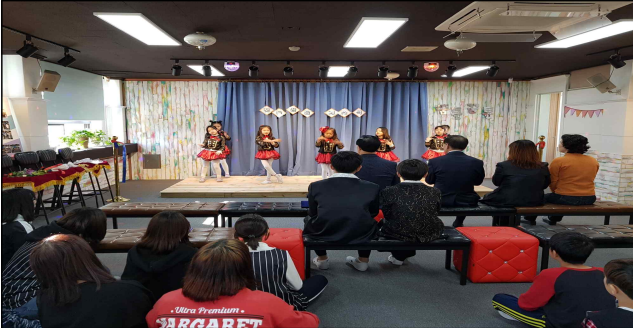
2018 영동 공간 개소(어등초 「꿈틀꿈틀」)